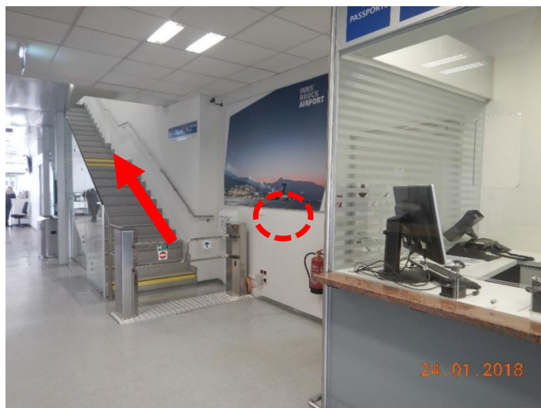
Foto Stiegenaufgang zum Crewraum

Der Zugangsschranken kann mit dem Taster an der Wand geöffnet werden