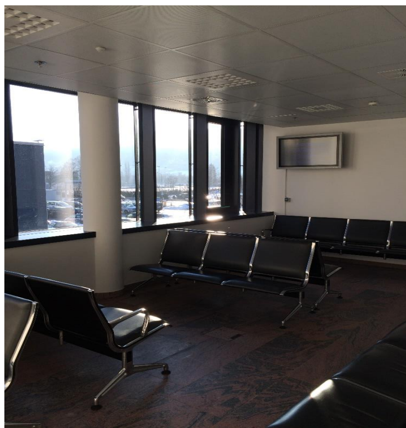
Crew Raum im 1.Stock

Der Zugangsschranken kann mit dem Taster an der Wand geöffnet werden